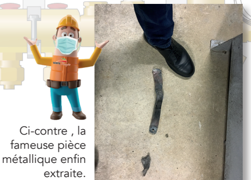
Ci-contre, la fameuse pièce métallique enfin extraite.

La disponibilité de la deuxième chaudière bois et la mise en service des chaudières gaz en secours, a permis d'éviter tout impact sur le niveau de confort des usagers. Cette opération de remise en état de la chaudière qui a duré plusieurs jours a été entièrement transparente pour les usagers.