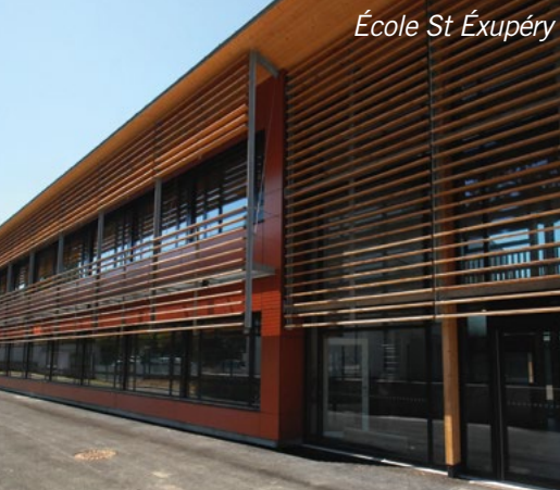
École St Exupéry