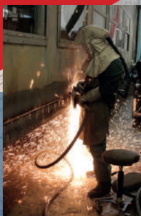
© SNCF – Technicentre Industriel de Saint-Pierre-des-Corps

Ce sont près de 700 personnes qui travaillent sur ce site. Tous les 18 ans les trains sont révisés, leur garantissant une durée de vie de 40 ans. Les équipes mettent "à nu" les trains pour assurer les missions de contrôles et de remise à neuf, notamment pour les sièges et les vitres.